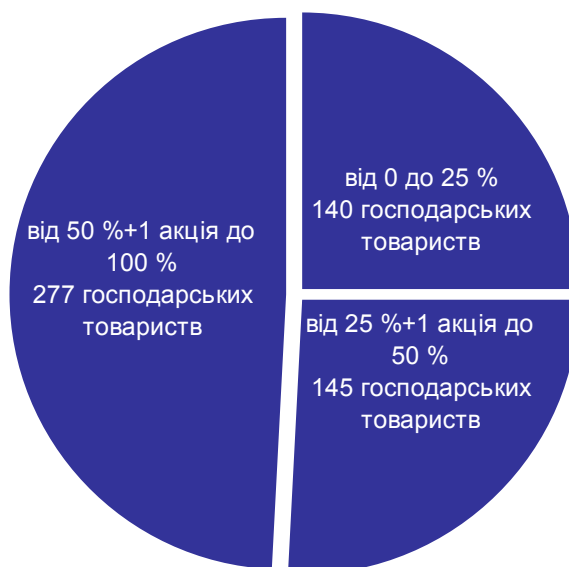
Діаграма 1. Розподіл корпоративних прав держави за розміром державної частки у статутному капіталі господарських товариств станом на 01 липня 2015 року

Загальна кількість пакетів акцій, часток, паїв, що належать державі у статутному капіталі господарських товариств, станом на 01 липня 2015 року порівняно з відповідним періодом 2014 року наведена у таблиці 7.1.